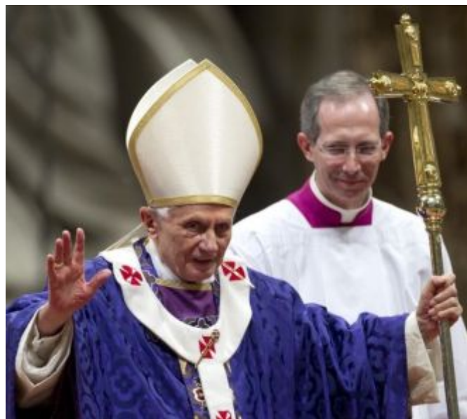
Bazylika Świętego Piotra, Środa Popielcowa, 13 lutego 2013 r. – papież Benedykt XVI przyjmuje owacje wiernych.

Na zakończenie Mszy świętej sprawowanej z okazji Środy Popielcowej 13 lutego br. papież Benedykt XVI zebrał długie, spontaniczne oklaski na stojąco. Taka była reakcja wiernych zgromadzonych w bazylice watykańskiej na słowa podziękowania Ojcu Świętemu, wypowiedziane przez kardynała Tarcisio Bertone. „Dziękujemy za danie nam światłego przykładu prostego i pokornego robotnika w winnicy Pana, ale który umiał w każdej chwili dokonać tego, co najważniejsze: nieść Boga ludziom i prowadzić ich do Boga.” – powiedział kardynał Bertone. Zgromadzeni w bazylice watykańskiej kardynałowie i biskupi zdjęli mitry z głów. Wiele osób trzymało chusteczki, by otrzeć łzy wzruszenia. Benedykt XVI przerwał długie brawa słowami: „Powróćmy do modlitwy” i następnie udzielił wiernym błogosławieństwa.